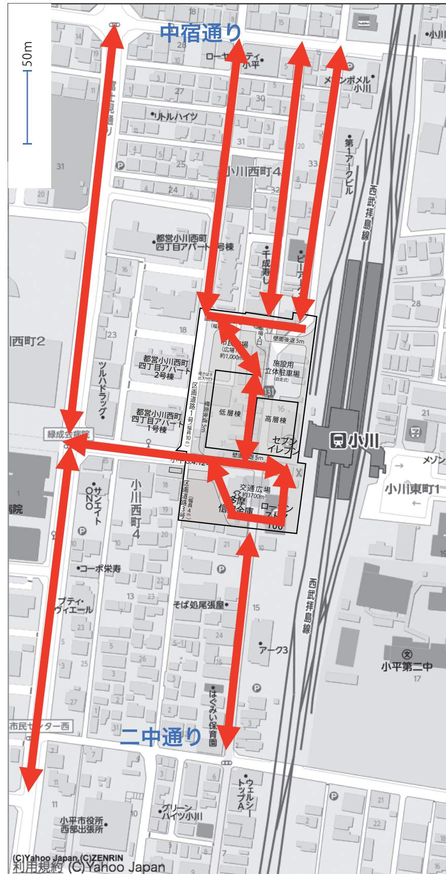
人・自転車の主な動線